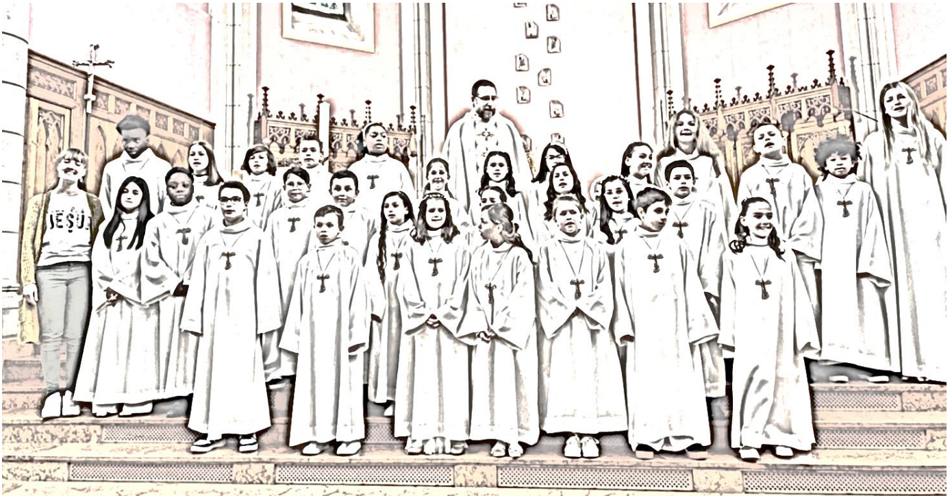
Souvenir (un peu flouté) de la première communion de La Chaux-de-Fonds Dimanche 21 avril 2024 – 23 enfants, 5 ados et 1 jeune